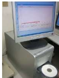
エラーチェッカー