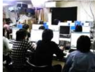
画像検査（バッチ処理後の各検査）

単価：電子化のみの場合 10円/コマ ~ 18円/コマ ※フィルム状態・梱包状態で変動 ※画像処理・検査内容で変動 ※テキスト入力等 不含（別料金）