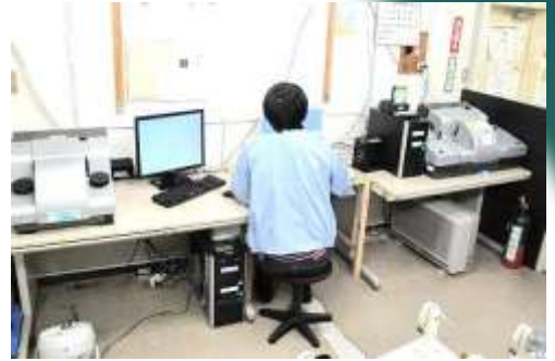
2~3台/名を担当 高画質・超高速 MFスキャナー

事例：見積り 35mmカラーネガ 6コマジャケット 解像度 600 dpi の場合