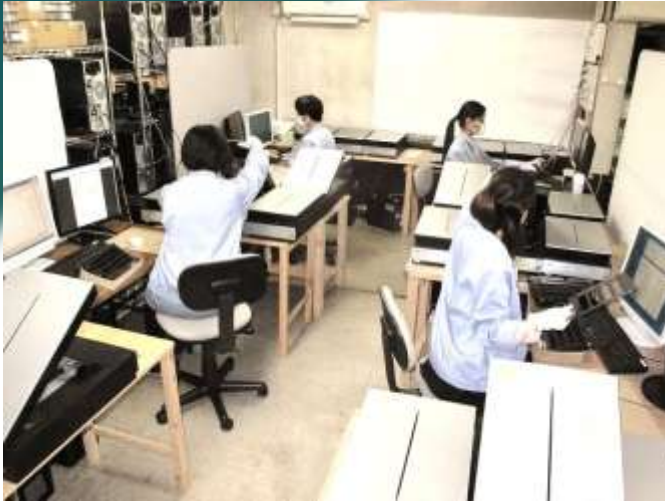
6~8台/名を担当 電子化・スキャニング作業