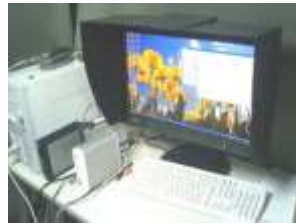
カラーマネジメント