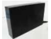
HDD・クラウド (協業) 等