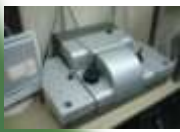
高性能フィルムスキャナー (フィルムスキャナー 50台以上の自社設備)