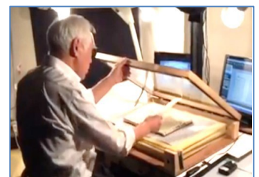
デジタル化 簡易な作業

大量電子化のプロジェクト の内容は非常に複雑で、大量なデジカメ撮影のための「前後の処理」、様々な機材の用意だけでなく準備するもの等の対応。そして膨大な数量の撮影作業の「高品質化」と「簡素化」に徹し、業務を管理、作業進行をしつつ、独自に企画・開発した管理・画像処理等の